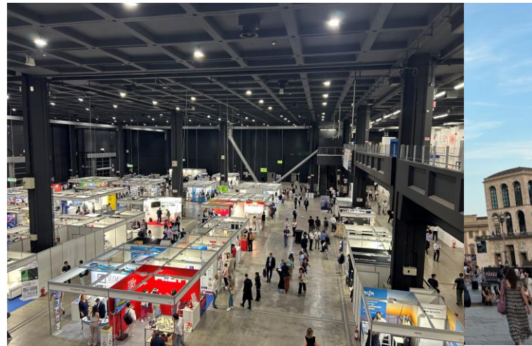
写真3 国際会議会場 展示スペース